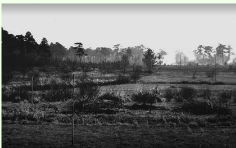
造営前の代々木の風景