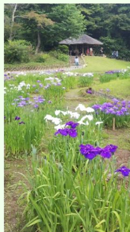
”御苑”内の菖蒲園ではハナショウブが見頃です