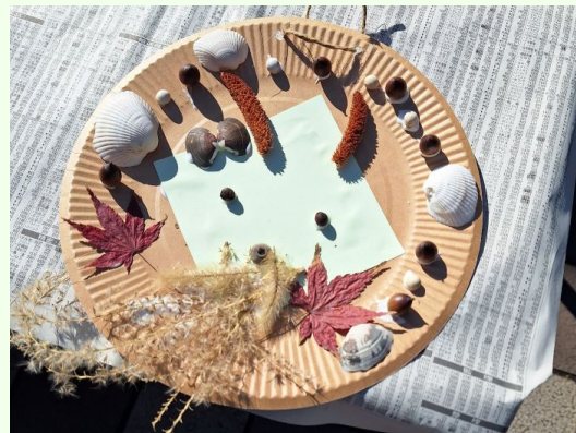
海で拾った貝も使ってくれました