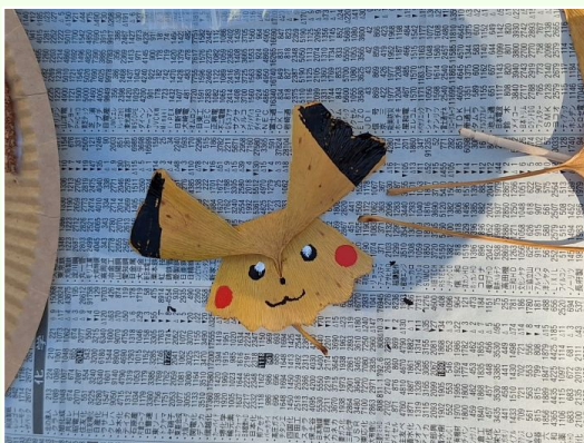
←イチョウの ピカチュウ