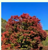
金太郎オオモミジ