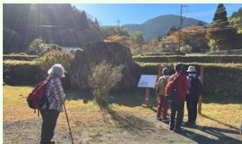
金太郎の遊び石「たいこ石」