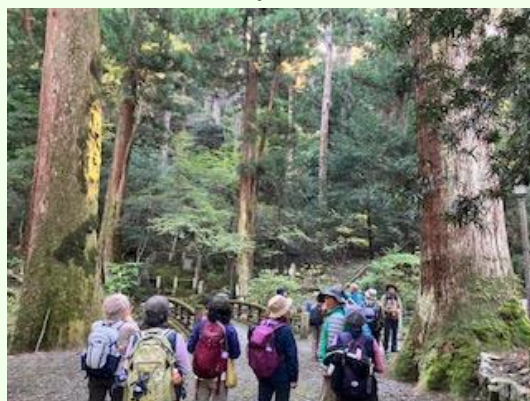
樹齢600年の老スギが林立する境内

●最乗寺は開創以来620年の歴史を数え当時から植えた樹齢が450~600年の老スギが林立し荘厳な雰囲気醸し、天狗伝説と相まって心身が清められるような曹洞宗の禅寺である。その老スギの根本付近や伐採後の切り株には実生も見られ、さらに見事な紅葉にも感激の趣であった。