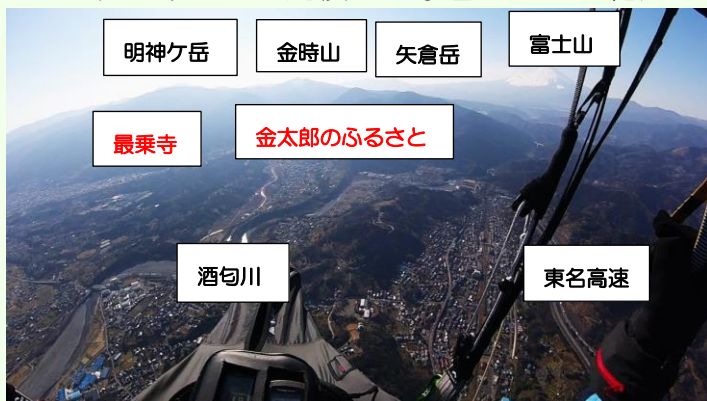
パラグライダーから撮影した今回の訪問地

今回の訪問地は足柄平野西部の南足柄市の大雄町に有る「大雄山最乗寺」と静岡県の県境に近い矢倉沢の「金太郎の伝説地」である。この地は私の趣味であるパラグライダーの基地近くで、空中からの見慣れた景色の魅力を紹介したいと思い企画した。