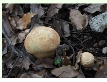
ノウダケがボコボコ。この他にも何種類ものキノコが観察できた。