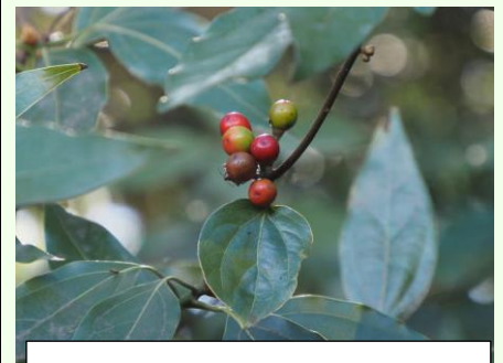
シロダモの実、開花を待つツボミと一緒に観察。