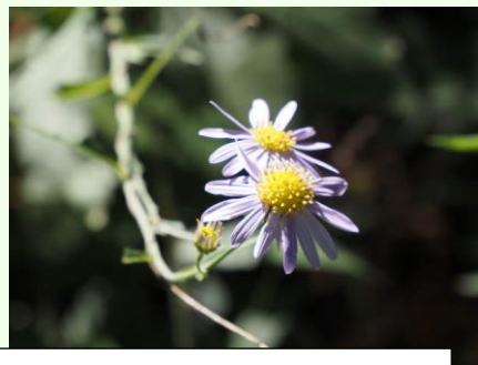
ノコンギクと名札がついていた。ここで野菊の知識の持ち寄りが。