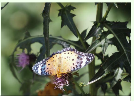
ツマグロヒョウモンの雌。タイアザミやセイタカアワダチソウで吸蜜