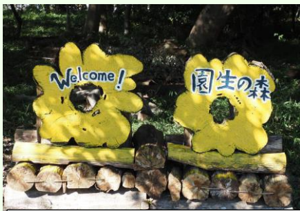
園生の森の入り口には手作り感満載の看板がお出迎え。

活動概要 当日は絶好のお散歩日和となりました。市民ボランティアがしっかり管理している、園生の森を歩きます。以前は針葉樹の暗い森だったということですが、今は落葉樹の多い、手入れがされた豊かな森です。タイアザミの花は多く見られましたが、花の季節から実りの秋に。何種類もの実が観察できました。陽だまりの広場でお菓子を食べながらお茶休憩。クヌギの根元に姿を見せていたオオスズメバチを観察し、それぞれのスズメバチ談義で盛り上がりました。天台スポーツセンターの中を通り、通る人もほとんどいない道をコシオガマを探しながら歩きましたが、今回は見つけることができませんでした。動物公園に向かう道では手の届くところにアケビが。優しい甘みをいただきました。丸々としたクヌギドングリを拾いながらの帰り道でした。