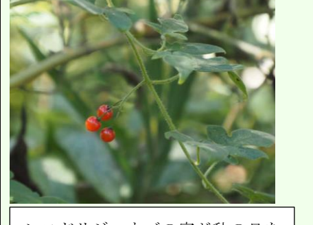
ヒヨドリジョウゴの実が秋の日をうけ透明になってきた。