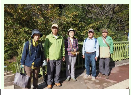
動物公園入口のクマシデの前でカップルを呼び止め撮影。