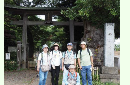
子安神社で集合写真