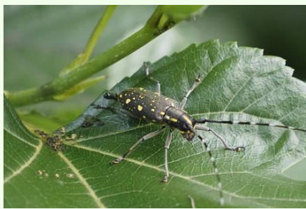
キボンカミキリ。食草のクワの葉の上で。