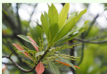
ホルトノキ。実がオリーブと間違えられたとも。もうじき花が咲きます。