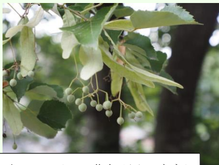
本日のメイン。花島公園のボダイジュ。花が終わり、独特な実が。

活動概要 京成の検見川駅から花見川サイクリングロードを歩いて、子安神社、花島観音のボダイジュを見学するコースです。浪花橋を渡るとホテイチクの竹林、花見川の土手側にはウマノズクサがあってジャコウアゲハが沢山飛んでいます。白鷺公園のオオガハス、ホルトノキ、サイカチの樹、ニッケイをみて子安神社。桓武天皇延暦年間（782-806）にこの辺りを支配する豪族により作られた子安古墳のお山をご神体として、五穀豊穡の神として創立されたとのこと。ケヤキとカヤの巨樹が印象的です。さらにサイクリングロードを進み、真言宗豊山派寺院の天福寺へ。花島観音として親しまれています。階段を登った右側にボダイジュがあります。手の届く高さなので誰でも観察は容易です。