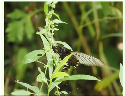
たくさんのジャコウアゲハが飛んでいます。