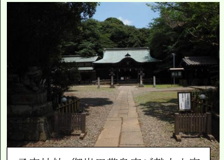
子安神社。御岩田帯皇室ご献上之宮