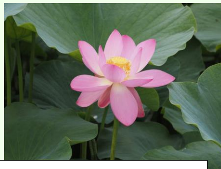
白鷺公園では、千葉市の花オオガハスの開花が見られました。