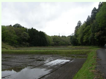
千葉市若葉区野呂町

里山は特別な場所ではなく、すぐ近くにあるが、近年、荒れてしまっているところが多くなっている。日本昔話に出てくる「おじいさんは山へシバ刈に」という光景が里山の原点と考えられるが、日本昔話を知らない世代が主流になっており、若い世代に伝えることが難しくなっている。