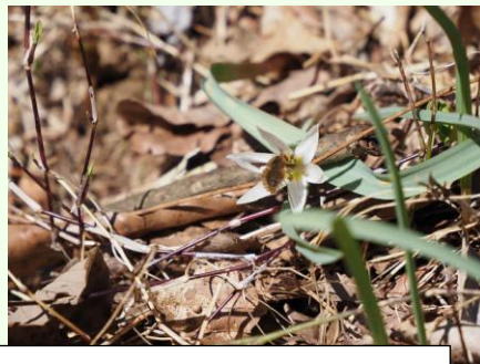
アマナに訪れるピロードツリアブ。こちらもスプリングエフェメラル