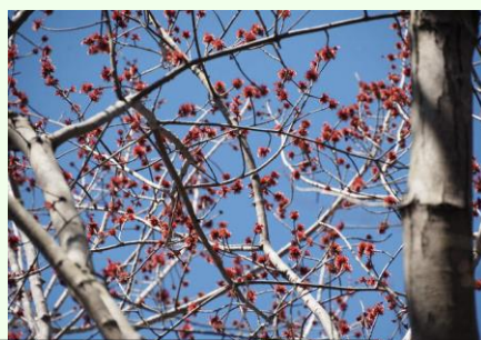
県木のひろばではハナノキの赤い雄花が見られました。