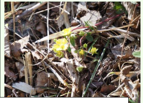
水はけの良い斜面には多くのキジムシロの黄色の花が鮮やか。