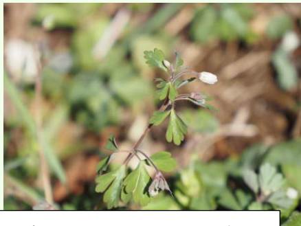
園内いたるところにヒメウズが見られました。