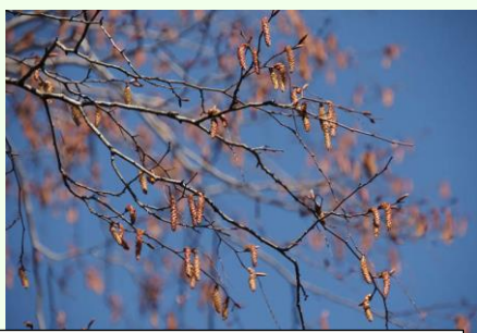
イヌシデに混ざってアカシデの雄花序も見られました。