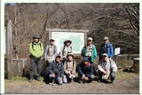
お散歩中の父子を呼び止め、マスクを外してパチリ。