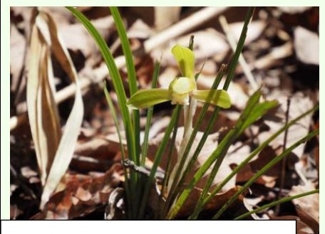
笹刈で人目に触れるようになったシュンラン。盗掘されないように、