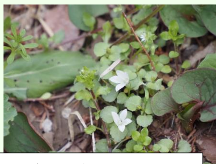
この時期にまさかのタニキキョウ。早すぎ！