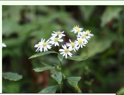
園内で一番多くみられる野菊、シロヨメナは最盛期でした。