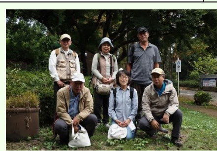
最後まで笑顔で集合写真。この後も園内管理のことなど話は尽きることなく、