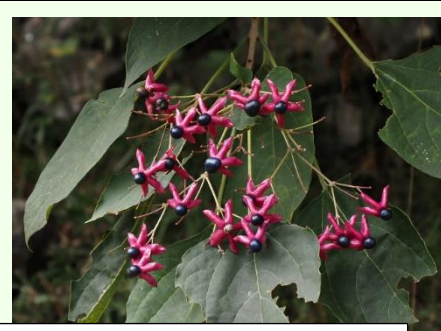
クサギの果実。際立つコントラストが目をひきます。