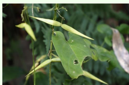
オオカモメヅルの果実。カモメの名前に納得。