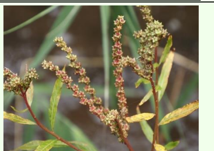
湿生植物園のタコノアシ。茹で上がるにはもう少し。