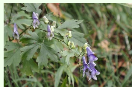
一際存在感を発揮する鮮やかな花色。ツクバトリカブトが随処に。