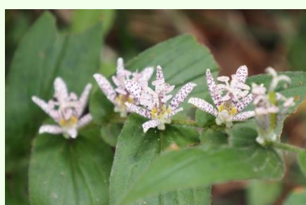
園内は少し前までヤマホトトギスでしたが、ホトトギスに入替わり。