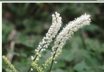
イヌシヨウマからサラシナシヨウマにバトンタッチ。