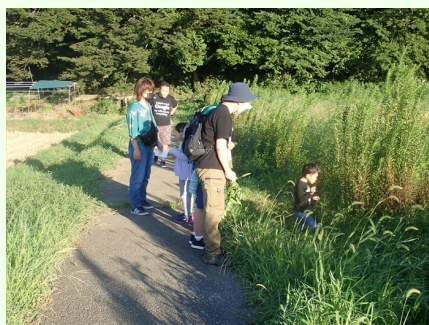
またまた何か見つけたよ♪