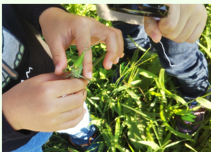
ショウリョウバッタ、つかまえた！