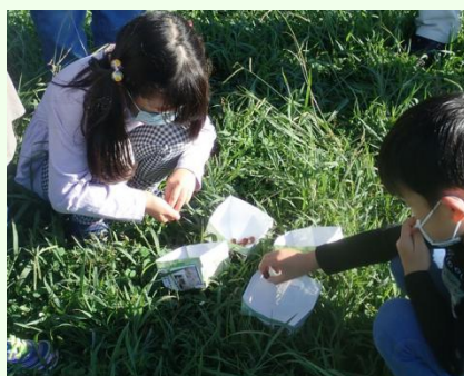
ドングリが多かったチームはどっち？