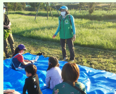
月とススキのお話に興味津々