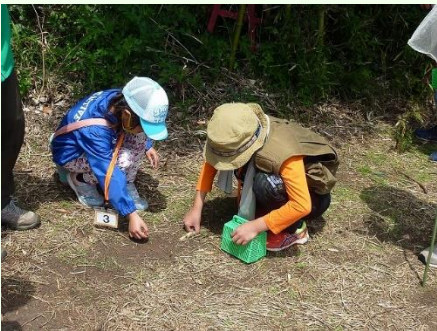
何がみつかったのかな？