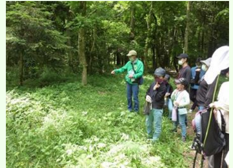
「あの植物は...」とインストラクターのお話