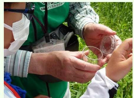
このムシ何？ 観察してみよう