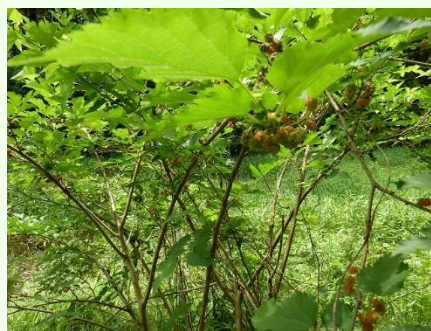
モミジイチゴ、おいしかった！