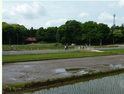
あの緑の山が、草深の森