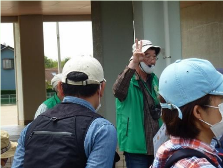
開会式後、注意する生物のお話

開会式後、簡単なネイチャーゲームと木の体操で、心身ともに森へ行く準備万端整え、5つの班に分かれて草深の森へ入った。